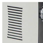
Принудительное движение воздуха TLS-603 T.