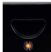
Световой индикатор работы. Ручка для переноски.