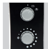
Ручка управления и термостат.